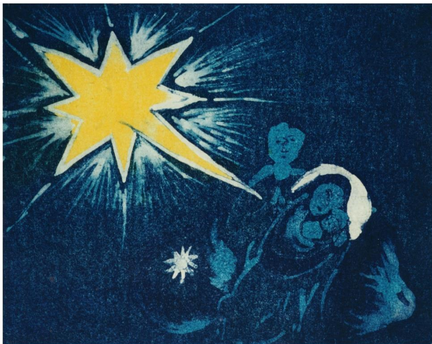
Batikarbeit von Gerhild Pröls

Als tiefes Schweigen das All umfängen hielt und die Nacht auf ihrem Weg die Mitte erreicht hatte, da kam, o Gott, dein allmächtiges Wort vom Himmel, von seinem Königsthron herab. (Weisheit 18,14-15)